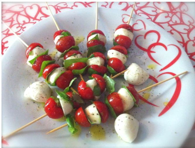
spiedini di pomodorini e