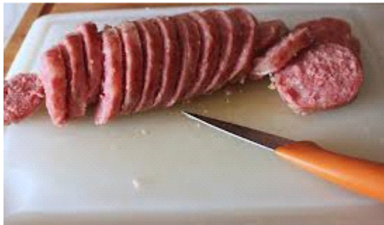
affetto del salame