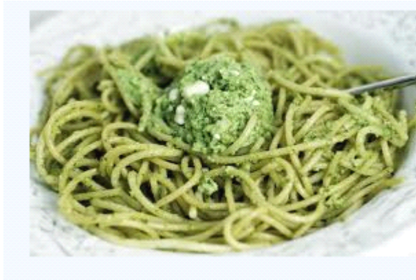
spaghetti al pesto-香蒜面

意大利面 网站: http://www.export-italy.com/Sanmichele/sanmichele-eng.htm