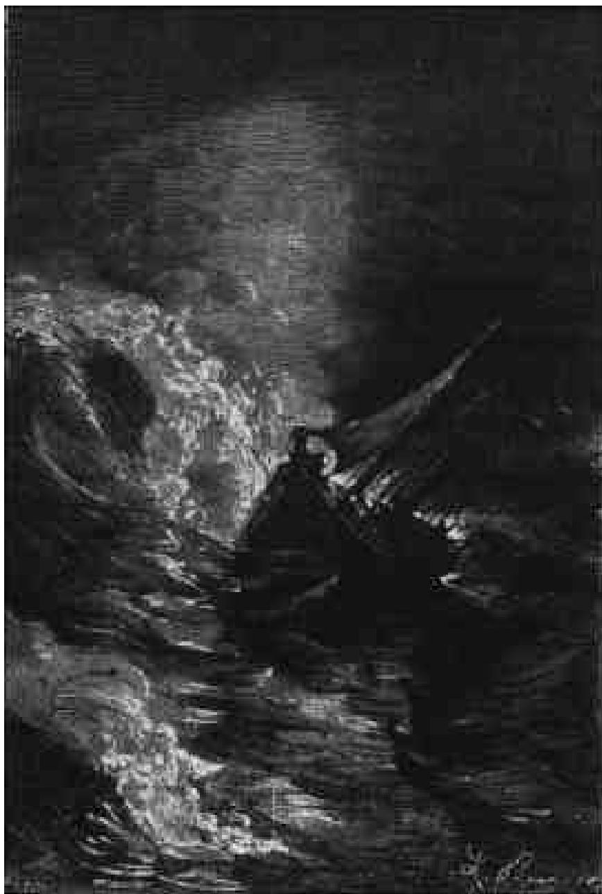
La Tankadère fut enlevée comme une plume.