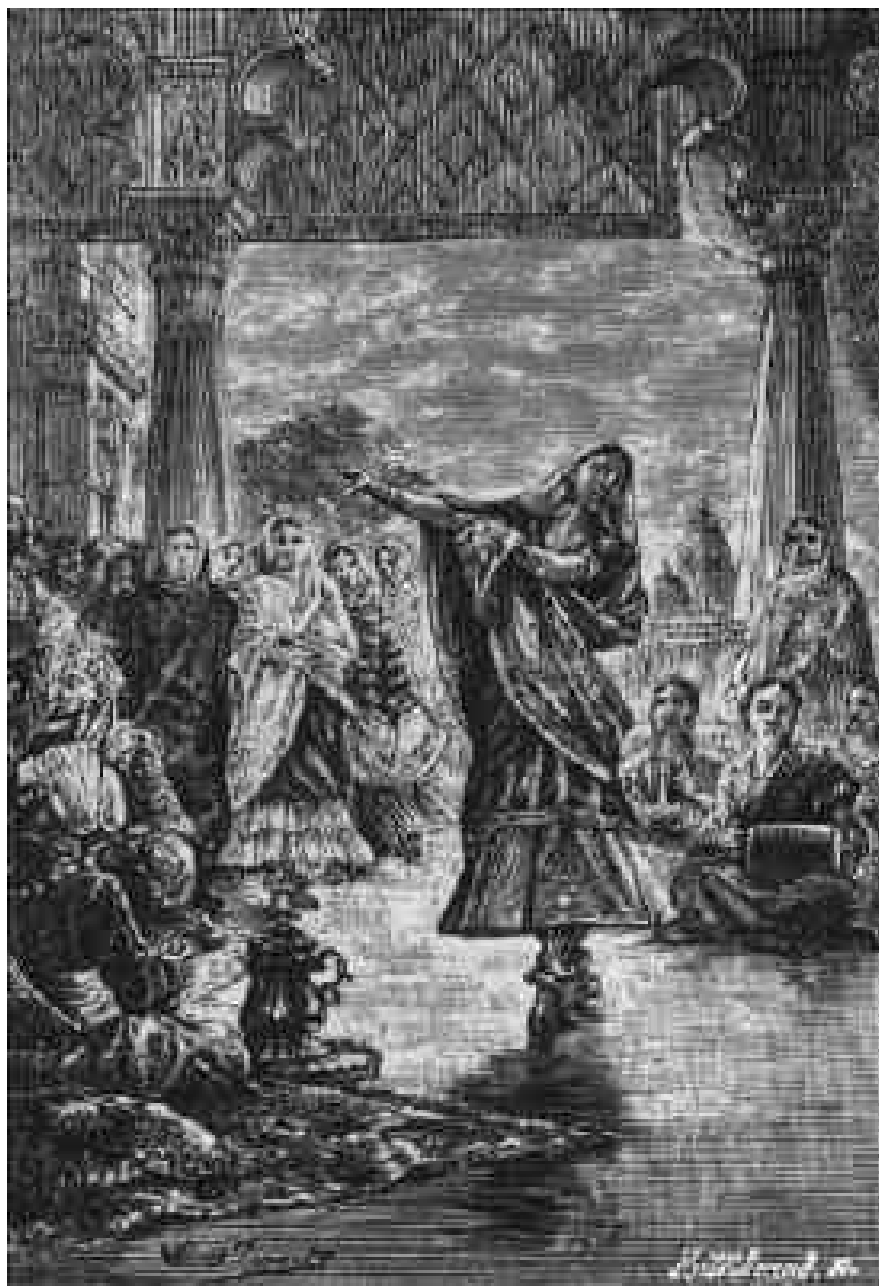
Les bayadères à Bombay.