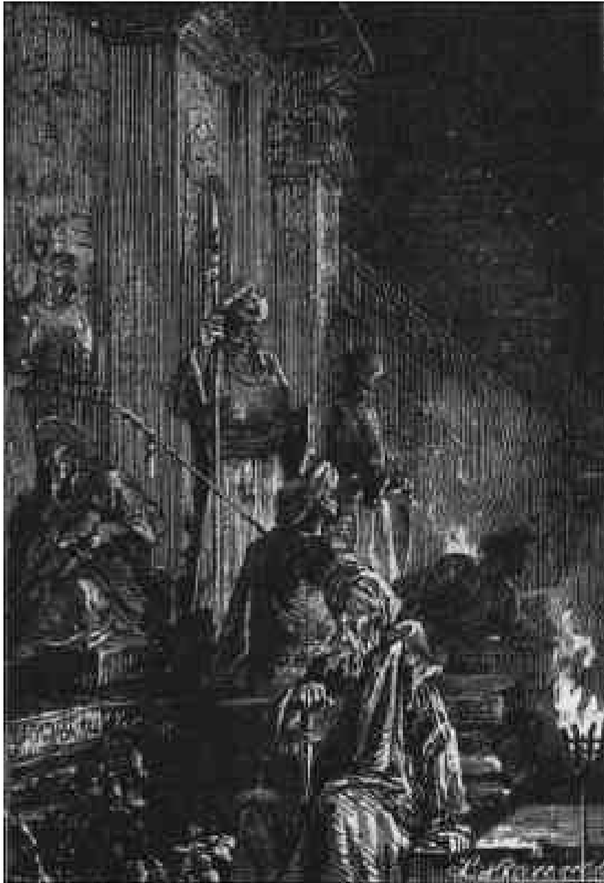
Les gardes des rajahs, éclairés par des torches...