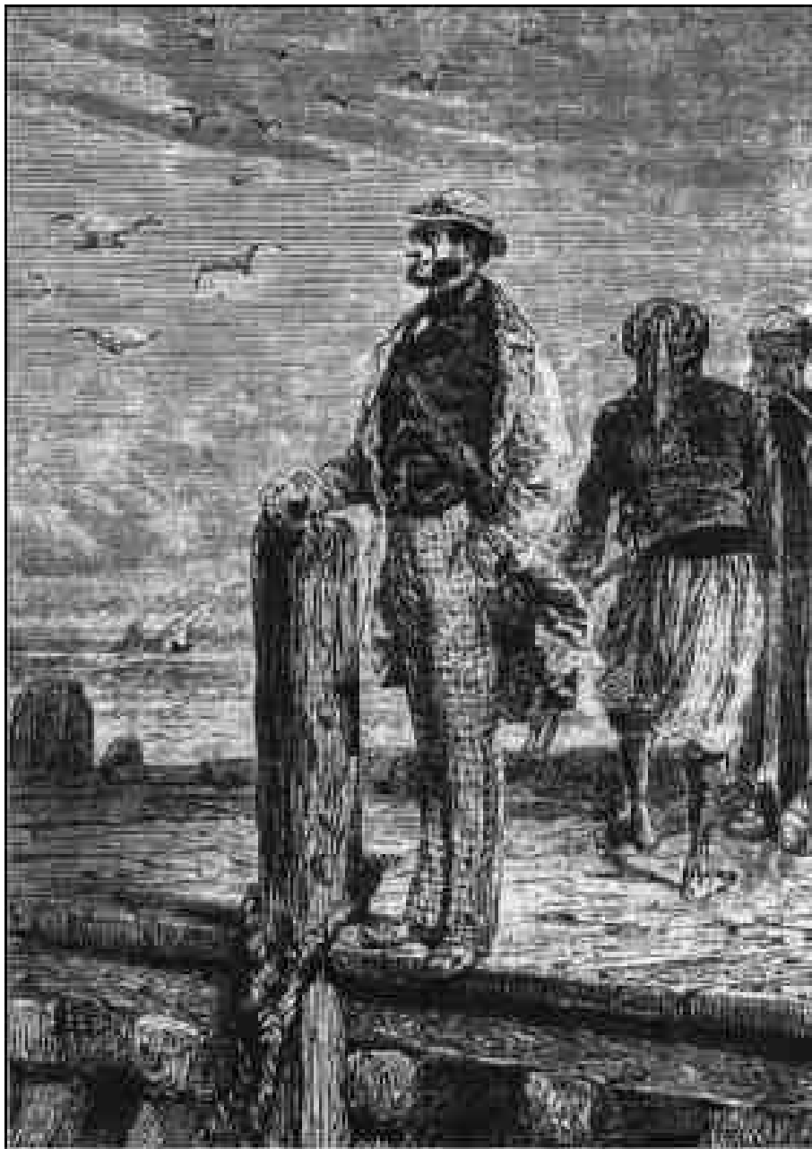
L'inspecteur de police.