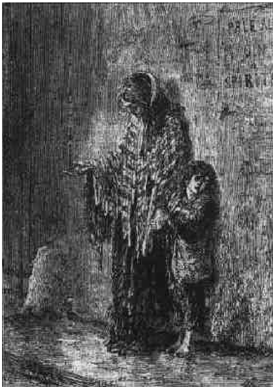
Une pauvre mendiante.