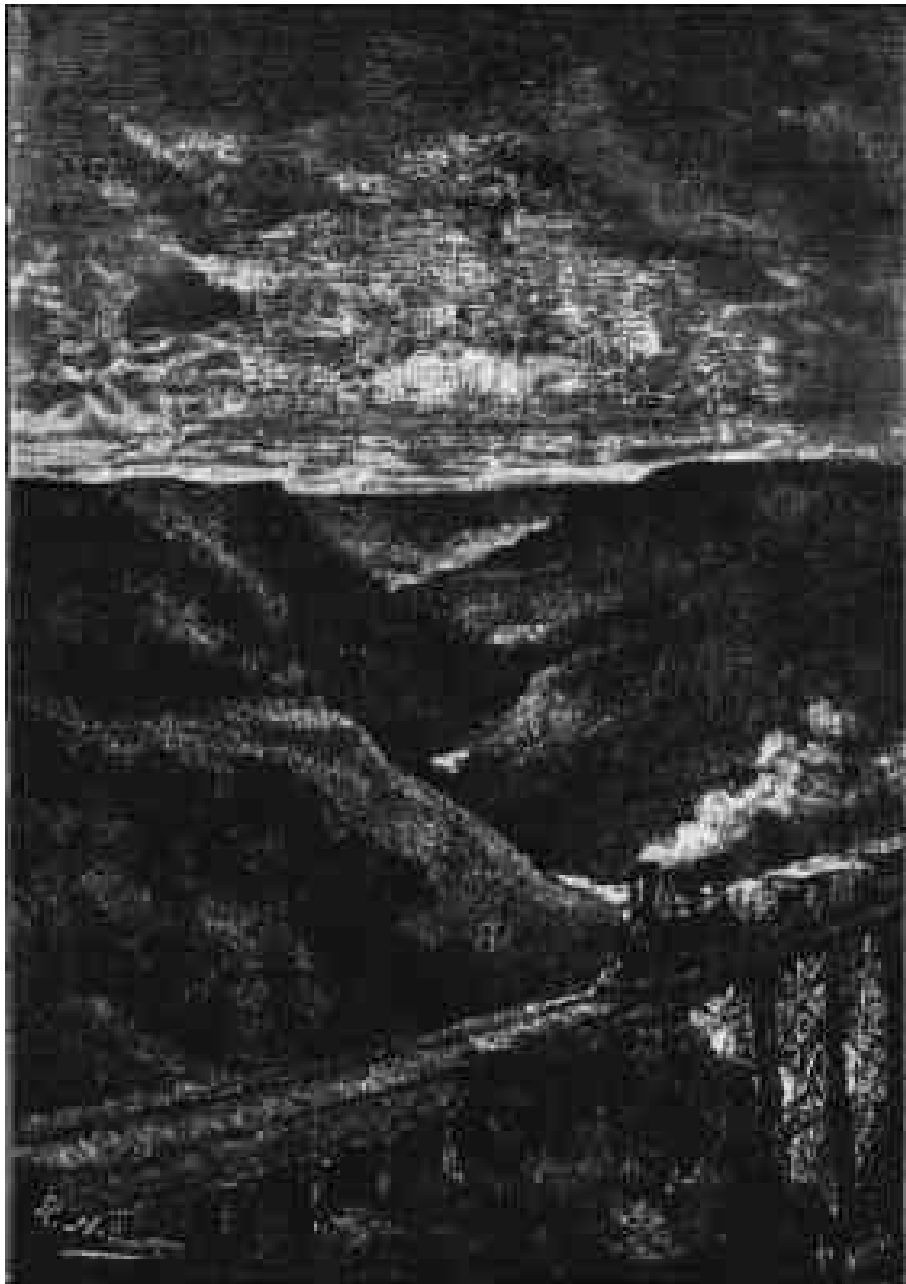
Un troupeau de dix à douze mille têtes barra le rail-road.