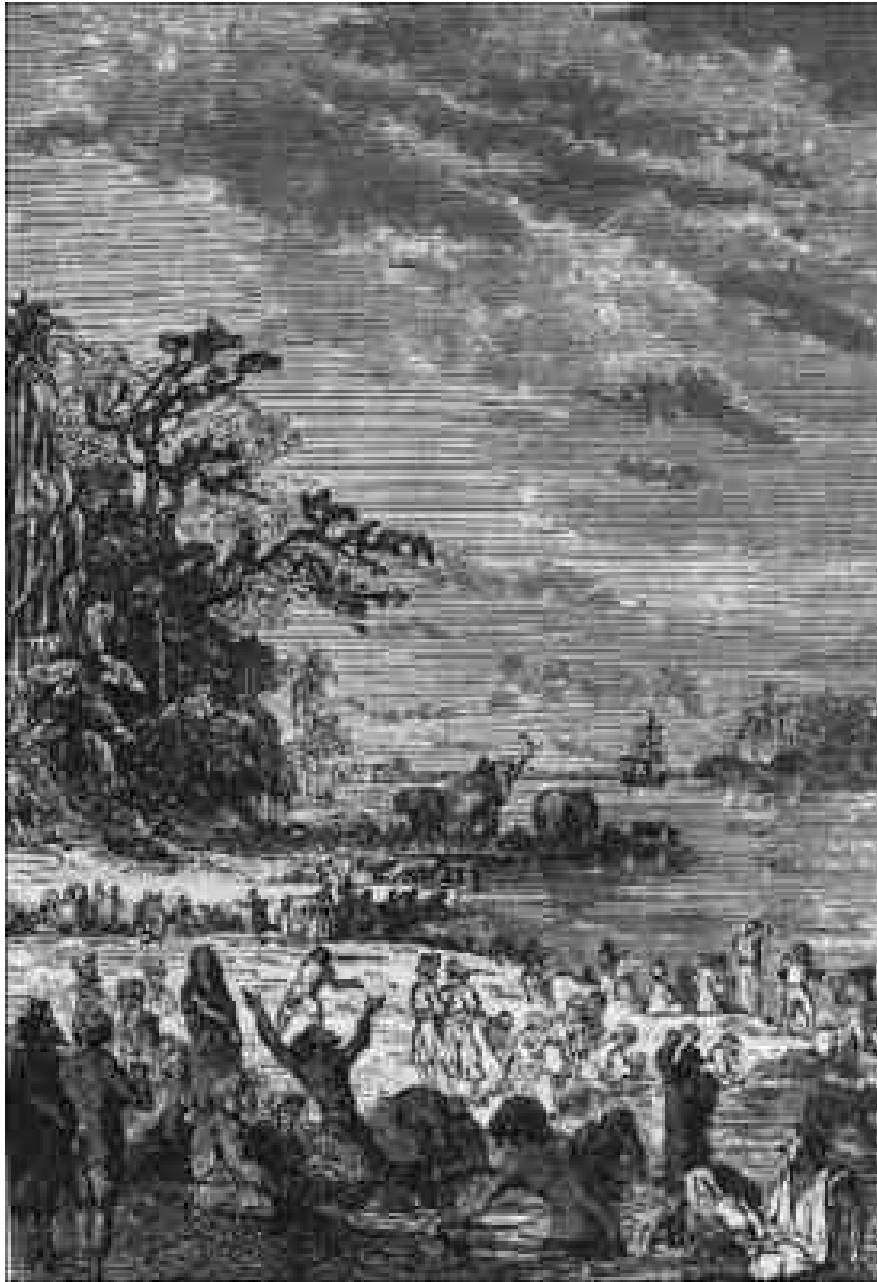
Des bandes d'indous des deux sexes.