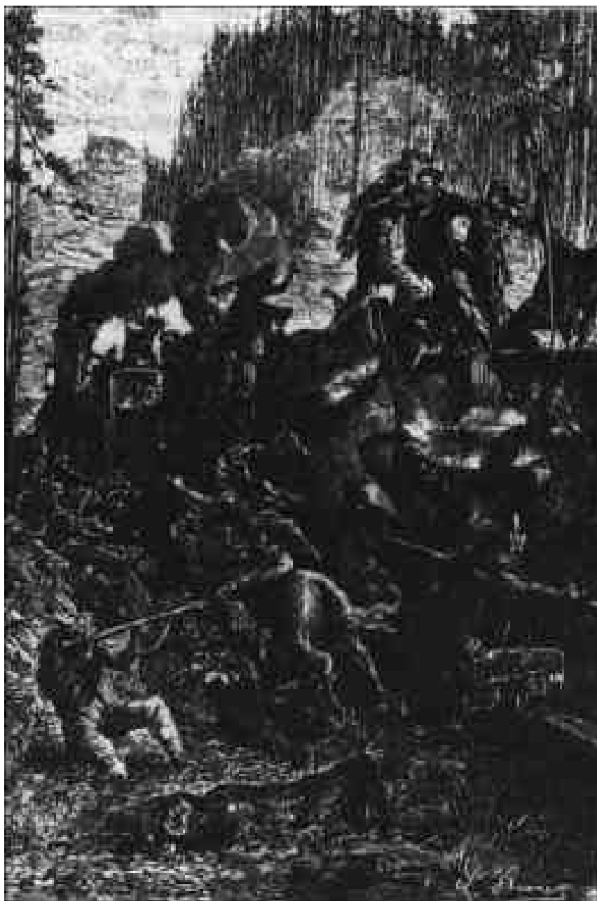
Les sioux avaient envahi les wagons.